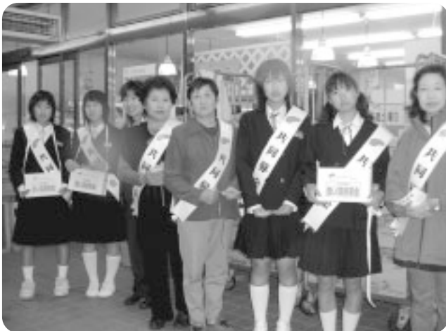
まるたけ騎西店にて