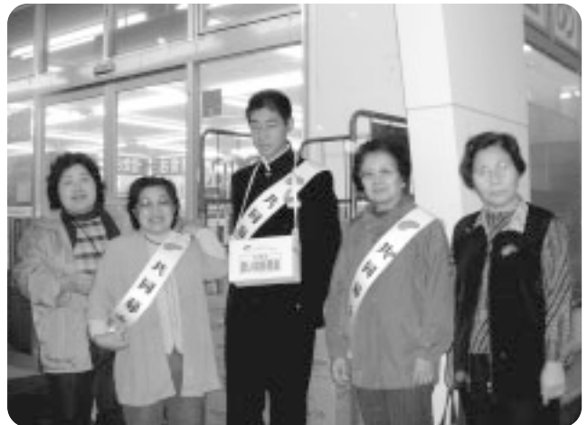
ドラッグてらしま騎西店にて