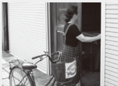
乳酸飲料を配達するボランティアさん