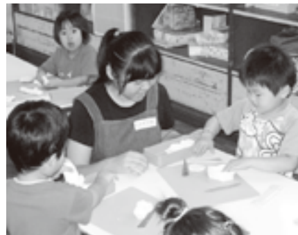
ボランティア体験プログラムの様子