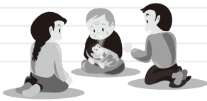
5月29日(火) 「子どもの救急法」 講師：日赤幼児安全法指導員