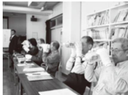
障がいのある子どもの「見えにくさ」の体験の様子 ～ K パートナー養成講座 ～